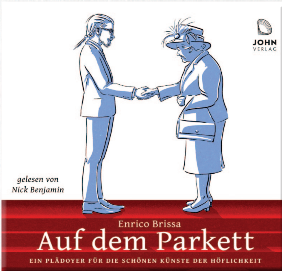
Illustration: © Birgit Schössow

Ein Protokollchef über weltläufiges Benehmen